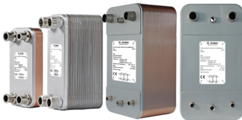
Рис.1 - Внешний вид теплообменников пластинчатых типа ВРНЕ

Теплообменники пластинчатые типа ВРНЕ предназначены для передачи тепловой энергии от одного теплоносителя к другому. Теплообменники пластинчатые типа ВРНЕ могут применяться в холодильных установках (компрессорных, абсорбционных), а также в тепловых насосах. В качестве рабочих сред могут использоваться с ГХФУ, ХФУ, ГФУ, ГФО и природные хладагенты не вступающие в реакцию с медью, технические и холодильные масла, вода для технических нужд и систем ГВС, спиртосодержащие растворы, водные растворы гликолей.